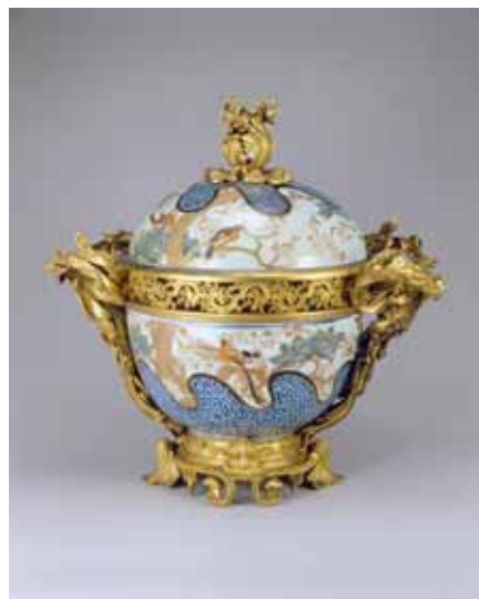
色絵花鳥文蓋付大鉢（1720～50年代）

本展覧会を監修し、USUI COLLECTIONの形成にあたって助言している大橋康二（おおはしこうじ）氏は、肥前磁器研究の第一人者であり、海を渡った陶磁器について、じつに幅広い見識をお持ちの方です。輸出磁器ならではの特徴や時代背景など、USUI COLLECTIONを中心にお話いただきます。