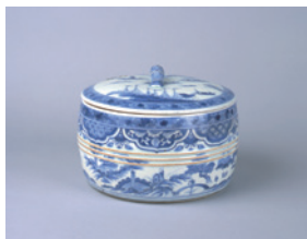
東山 染付祥瑞写山水図水指 江戸時代後期 兵庫陶芸美術館

やきものは、人類が化学変化を意識的に応用し、生み出したといわれていますが、現在に至るまでには、形や色合い、装飾などにさまざまな技術が取り入れられ、変化してきました。この展覧会は、釉薬編に続く第2弾「装飾編」として、多彩な装飾技法を当館の古陶磁および、現代コレクションを中心に紹介します。