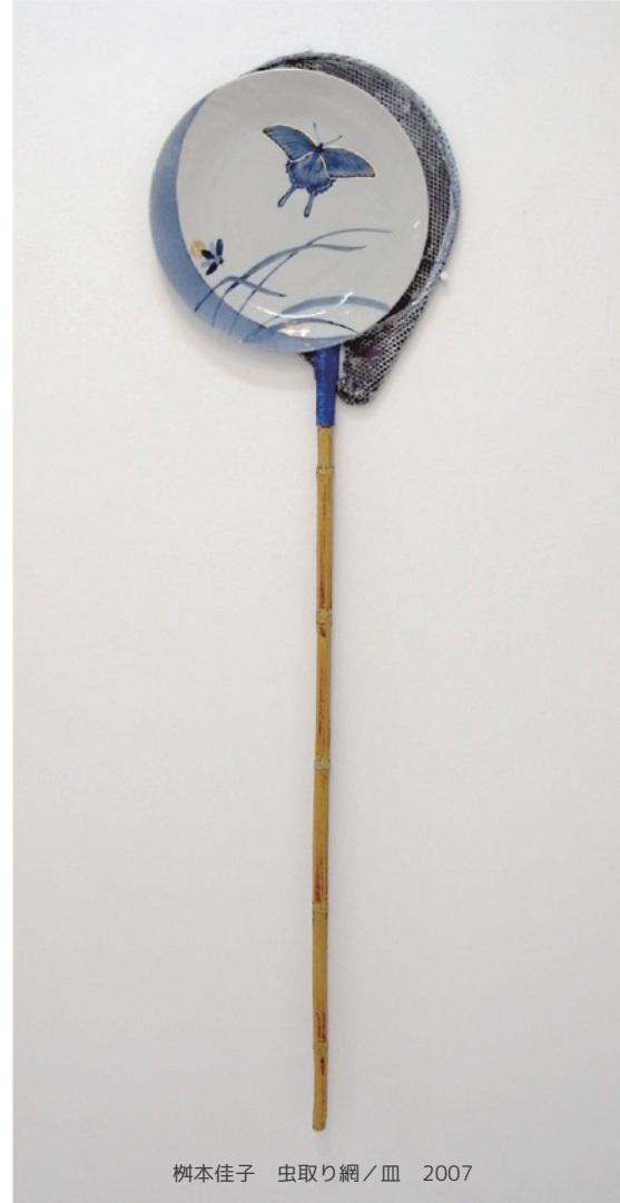
榎本佳子 虫取り網/皿 2007