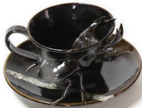
榎本佳子 クワガタ/カップ&ソーサー 2016

2011 美術の中のかたち一手で見る造形 榎本佳子展「やきもの変化」（兵庫県立美術館） 2012 個展 motif/vessel（ICN gallery / ロンドン） 2016 Hyper Japanesque（Esplamade / シンガポール） 2017 個展 Masumoto EXPO（アートフェア東京 村越画廊ブース）