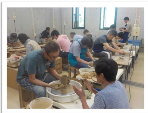
窯元指導による作陶風景