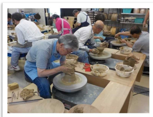
窯元指導による作陶風景