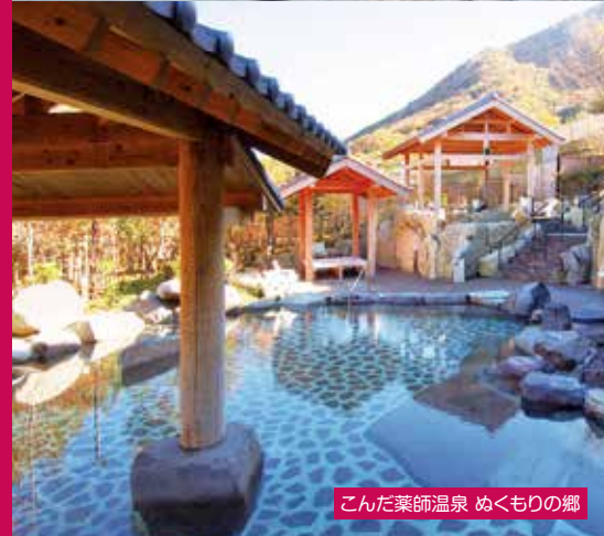
こんだ薬師温泉 めくもりの郷

JR篠山口駅を起点に、こんだ薬師温泉を経由し、兵庫陶芸美術館がある丹波焼の里と篠山城下町を結ぶ直通バスを期間限定で運行します。バスでのんびり、2つの日本遺産「丹波篠山デカンショ節」「きつと恋する六古窯」のまち・丹波篠山の魅力をお楽しみください。