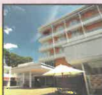
ホテル北野プラザ六甲荘 大人ペア宿泊券 (5組10名様)

ホテル北野プラザ六甲荘 ホテルウィングインターナショナル姫路 株式会社Sevensseas Cruiser 株式会社夢こんだ 豊岡市城崎支所 布袋クリエイティブ合同会社