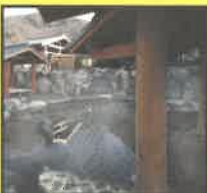
こんだ薬師温泉ぬくもりの郷 大人ペア入浴券 (5組10名様)