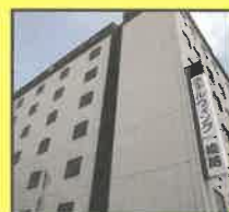
ホテルウィング インターナショナル姫路 大人ペア宿泊券 (5組10名様)