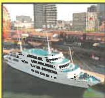
Sevensseas Cruiser コンチェルト 大人ペア乗船券 (5組10名様)