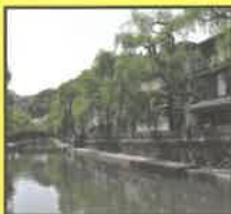
城崎温泉外湯めぐり 大人ペア入浴券 (5組10名様)