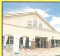
三田まほろばプレッツァ 施設利用券 (¥2,000) (5名様)