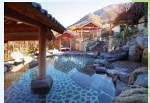
こんだ薬師温泉「ぬくもりの郷」

広々とした大浴場と露天風呂でゆっくりおくらげいただけます。 【料金】中学生以上 700円 / 小学生 300円 / 幼児 無料