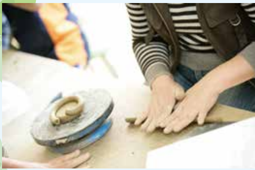
丹波伝統工芸公園「陶の郷」

古式の建築様式や荘厳な装飾など、往時の雰囲気再現されています。 【料金】大人 400円 / 高校・大学生 200円 / 小・中学生 100円