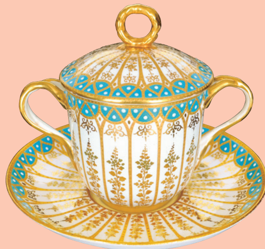
コペンハーゲン 《金彩野花文蓋付きカップ&ソーサー》 1891-1930年頃