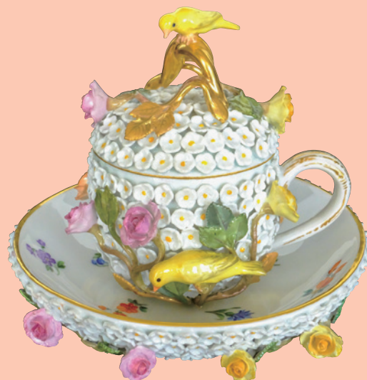
マイセン 《貼り付け花鳥とスノーボール蓋付きカップ&ソーサー》 1860-1880年