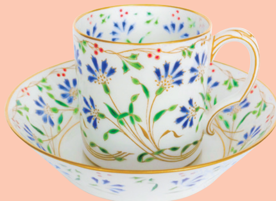
カミーユ・ノド 《ブライカジュール草花文カップ&ソーサー》 1900年頃