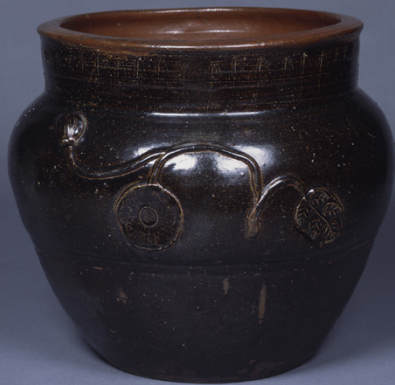
— 黒 —