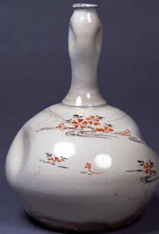
— 白 —