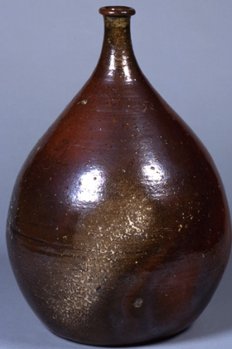
— 赤 —