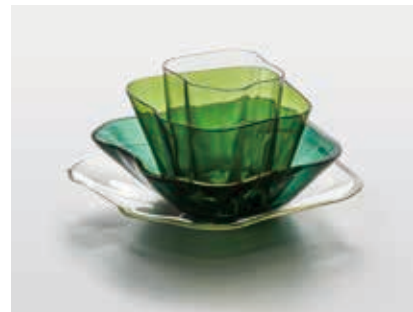
アルヴァ&アイノ・アアルト《アアルト・フラワー[3031,3032,3033,3034]》1939年 カルフラ/イッタラ・ガラス製作所 コレクション・カッコネン