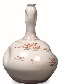
丹波《色絵桜川文徳利》江戸時代後期（19世紀）兵庫陶芸美術館（田中寛コレクション）兵庫県指定重要有形文化財